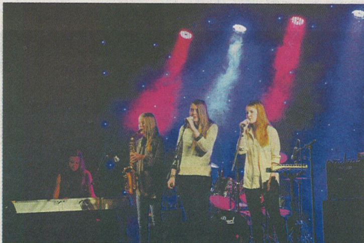
HJERTEKNUSERE: Yatzy med en god versjon av en nydelig låt.

– Bortsett fra et par småfeil gikk det bra, sier Nyberg. Dette er også første gang de synger på