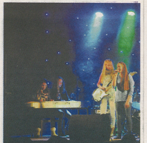
KREATIVE: Kombinasjonen musikkvideo og en med The Movie Makers.